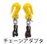
チェーンアダプタ