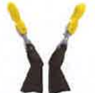
チェーンアダプタ