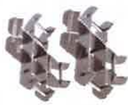
クロスラムサポート